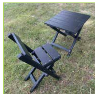
《折りたたみ テーブル・イス》