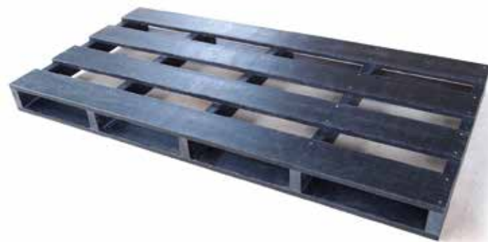
《射出成型規格外パレット》