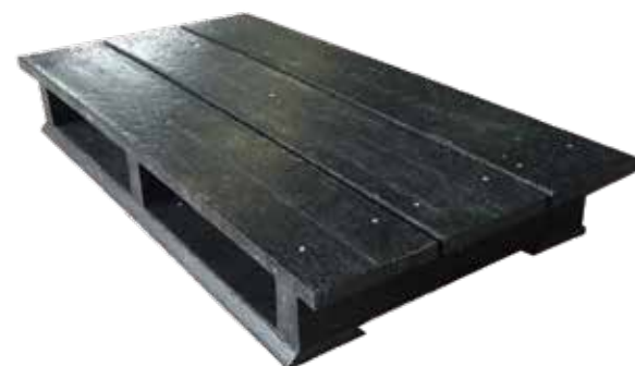
《スチールコイル用井ゲタパレット》